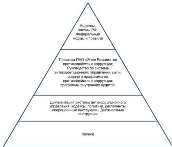
Рисунок 2. Структура документированной информации системы антикоррупционного управления

Форма Реестра документированной информации системы антикоррупционного управления ПАО «Энел Россия» приведен в Приложении 1 к данному Руководству (примечание: Перечень документированной информации является обновляемым документом, ведется в формате Excel на корпоративном портале).